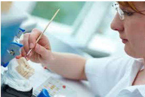
პროფესიული საგანმანათლებლო პროგრამის სახელწოდება: კბილის ტექნიკოსი

დასაქმების სფეროები – კბილის ტექნიკოსის III საფეხურის პროფესიული კვალიფიკაციის მფლობელს შეუძლია დასაქმდეს კბილის სატექნიკო ლაბორატორიაში.